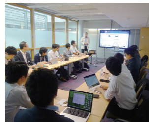
▼ IRT SystemXにて研究者と意見交換(フランス)