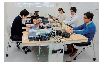
実証実験に取り組む受講生たち