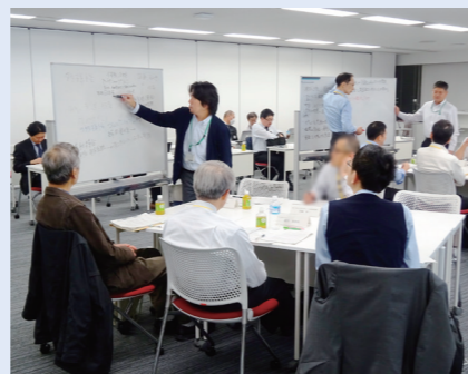
受講者によるグループワークの様相

閣議決定された平成30年7月のサイバーセキュリティ戦略に、経営・事業戦略上のリスクに対応する人材となる「戦略マネジメント層」というキーワードが盛り込まれました。この新たなサイバーセキュリティ人材の育成ニーズに応え、総務や戦略企画・広報などの管理部門でリスク管理全般に関わる責任者を対象とした、「戦略マネジメント系セミナー」を新設。2018年11月から12月にかけて、週1回夕方、計7回実施しました。セミナーは、専門家からの講義とグループごとのケースディスカッションの二部構成で実施されました。ディスカッションの場では、組織におけるセキュリティ対策に必要な機能などについて、業種や立場の異なる参加者の間で活発な議論が交わされました。