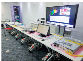
実証実験で使用された次世代の映像伝送機器など

さっぽろ雪まつりの高精細なライブ映像を、東京や大阪にリアルタイムで配信する実証実験(51組織約200人が参加)に受講生が参加し、テレビ放送などで実際に使用されている