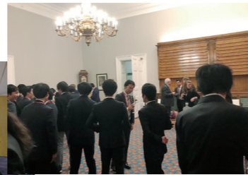
▲セキュリティ関係者とのネットワークイベント(イギリス)