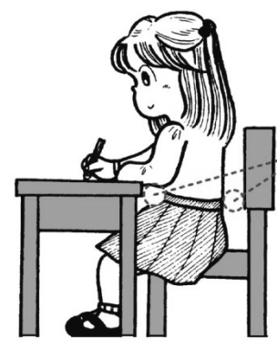
背すじをのぼしましょう