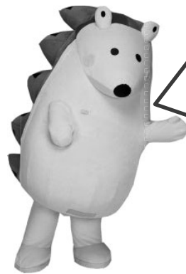
コンクール応援隊長まもるくん

みなさんは、パソコンなどでインターネットをつかったことがありますか？ インターネットは、ニュースや音楽、ゲームなどたくさんの方が手に入れることができる便利なものです。しかし、つかいかたをまちがえると、わるい人から電子メールがおくられて来たり、知らないうちにほかの人をきずつけてしまったりすることがあります。インターネットをつかうときにもルールやマナーがひつようです。どんなことにちゅういしなければいけないのかを考えてみましょう。