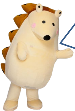
コンクール応援隊長まもるくん

インターネットは、ニュースや音楽、ゲームなどたくさんさんのじょうほうを手に入れることができるべりなものです。しかし、つかいかたをまちがえると、わるい人から電子メールがおくられて来たり、知らないうちにほかの人をきずつけてしまったりすることがあります。インターネットをつかうときにもルールやマナーがひつようです。どんなことにちゅういしなければいけないのかを考えてみましょう。