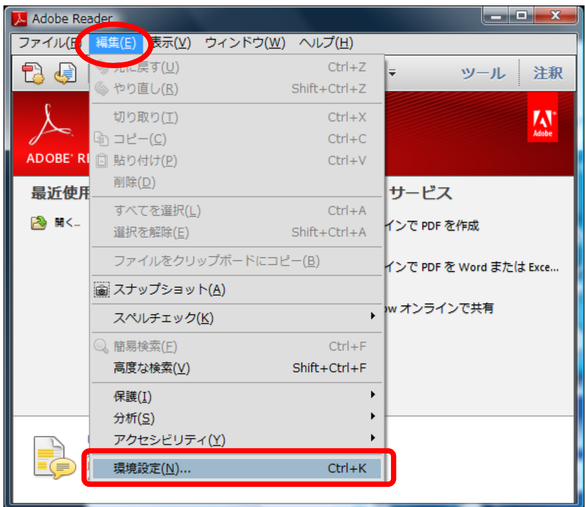
図 1 : Adobe Reader 起動画面