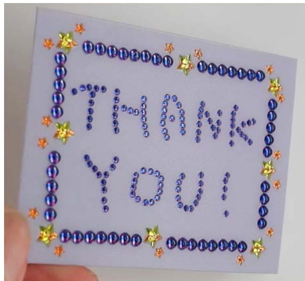
メッセージカード