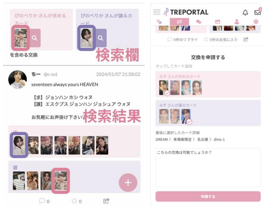
図2 (左) 交換の検索, (右) 交換の申請