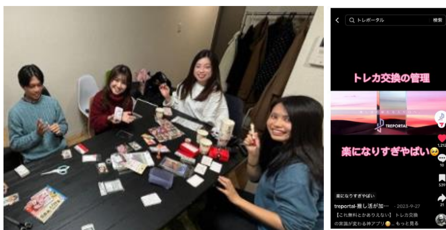
図 4 （左）プレゼントの梱包，（右）SNS に投稿したサービス紹介動画