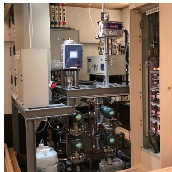
熱資源循環プラント

2つの異なる機能を持つプラントと、それらを統括して制御するシステムで構成されています。 まず、「温度差発電プラント」では水より沸点の低い物質を、温水の熱で気体化させることでタービンを回して発電します。また、気体化した物質を冷水で冷やして液体に戻し、再び発電に利用しています。 次に、「熱資源循環プラント」は定められた水質、温度にて温水を循環させるプラントになっています。温水の濁度やpH、塩素濃度などを計測し、それに応じて薬品の混合・攪拌を行うなど水質を一体的に制御できるようになっています。また、昇温機の稼働や、冷却水や温水の注入により、定められた温度になるように制御しています。 さらに、「熱資源活用制御システム」が上記2つのプラントをつなぎ、温水(熱資源)を受け渡すなど、全体を連続的かつ自動的に制御しています。