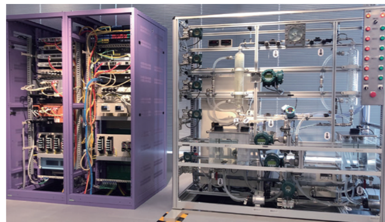
温度差発電プラント

ICSCoEでは、秋葉原UDXに新たな演習装置として、液体や気体などの流体を一元的に制御するPA (Process Automation) プラントを構築しました。「熱資源活用制御システム」と名付けられた新たなプラントは、システムを構成する要素それぞれがフィードバックを行いながら制御を行う分散制御システム (DCS : Distributed Control System) となっており、今後の演習の幅がさらに広がることとなります。以下では新プラントの概要、意義についてQ&A形式でご紹介いたします。