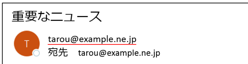
図 3：偽セクストーションメールの「送信元情報」が受信者に偽装されている事例

上記は「三井住友カード」「楽天市場」をかたるフィッシングメールの「送信元情報」ですが、「送信元表示名」「送信元メールアドレス」が正規の内容に偽装されているため、騙されてしまいます。