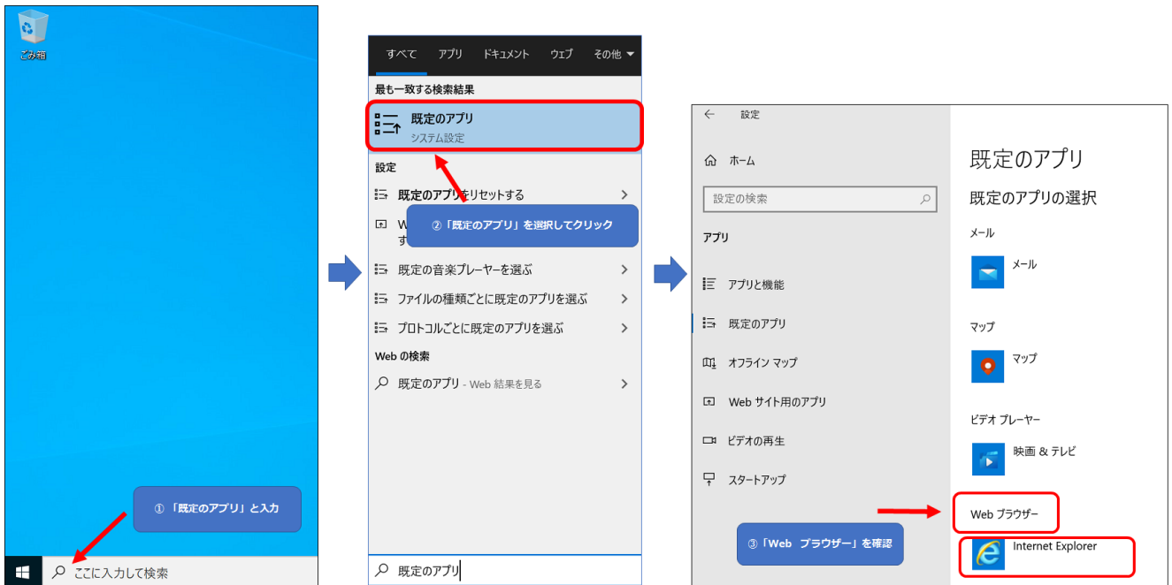
図 3：「既定のブラウザ」確認方法の一例（Windows 10）

なお、企業や組織の業務パソコンで「Internet Explorer」が設定されている場合は、自社のシステム管理者に確認の上、システム管理者の指示に従って対処を進めてください。