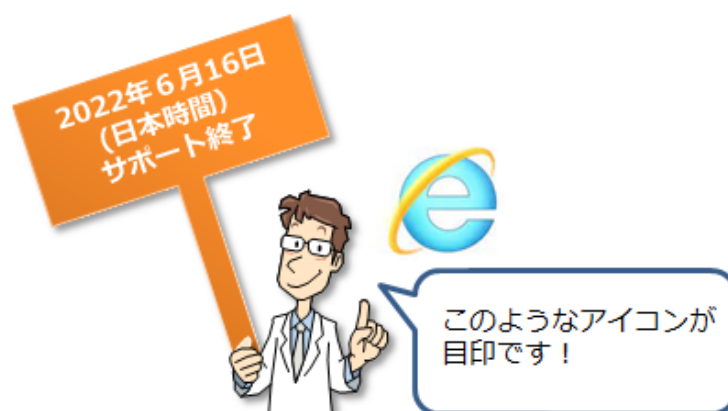
図 1：サポートが終了する「Internet Explorer」アイコン（イメージ）

そこで、今回 IPA では当該ブラウザが Windows パソコンの利用者に広く利用されてきた状況を踏まえ、サポート終了の 1 年前を迎えるにあたり、サポートが継続するブラウザへの切り替えについてご案内します。