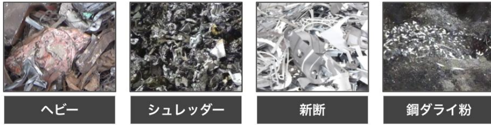
図 1 鉄スクラップ品種画像例

加えて、鉄スクラップは品種ごとに、長さや厚みといった基準で、より詳細な等級区分が規定されている。品種の中で、最も流通量大きいヘビー（全体の 60%）について、HS, H1, H2 の 3 等級の分類を行った。結果、未知のテストデータにて 93%の精度での分類を達成した。以下に等級画像例を示す。ヒアリングの結果、現場専門員の等級分類精度は、80%程度であり、対象種でのスクラップ分類では目視での作業代替に必要な精度を達成した。