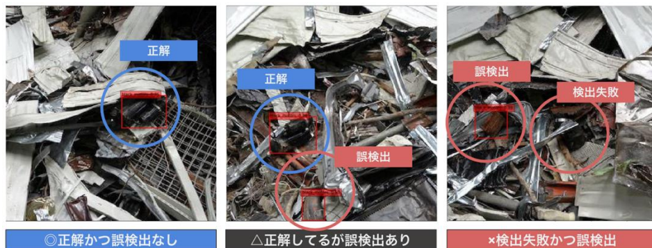
図 3 コンプレッサー検出結果例

異物検出では、鉄スクラップ中に混入する Cu や Sn といった不純物を多く含む、様々な種類の異物の検出が求められる。本プロジェクトでは、特に重要な異物 4 種であるコンプレッサー、モーター、電装品、バルブの検出モデルを構築した。未知のテストデータに対し、80%の精度で検出を行うことができた。以下に検出結果例を示す。ヒアリングの結果、現場専門員の検出精度は、50%程度であり、コンプレッサーの検出に関して、目視での作業代替に必要な精度を達成した。