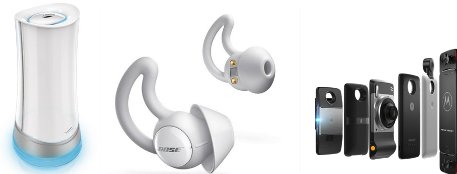
図表 5: Indiegogo Enterprise でキャンペーンが行われた製品 (左から、P&G 社 "Airia Electronic Scent Dispersal™", BOSE 社 "NOISE-MASKING SLEEPBUDS™", Motorola 社 "moto z3™")