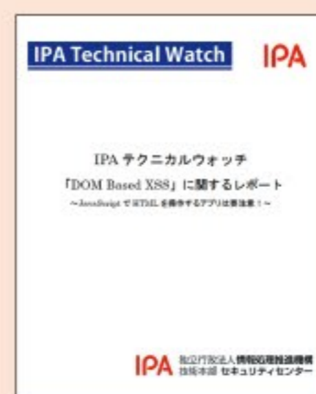
IPAテクニカル・ウォッチ