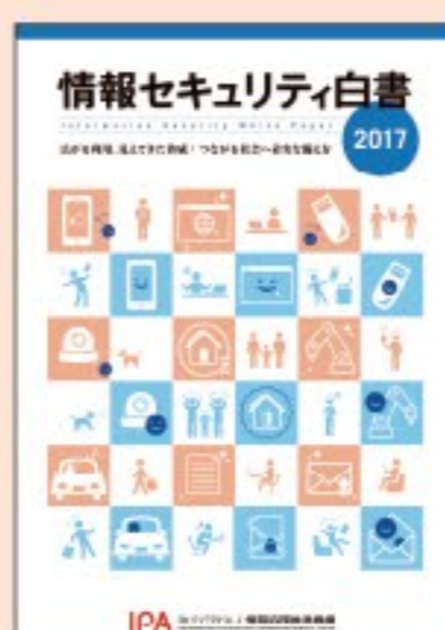
情報セキュリティ白書