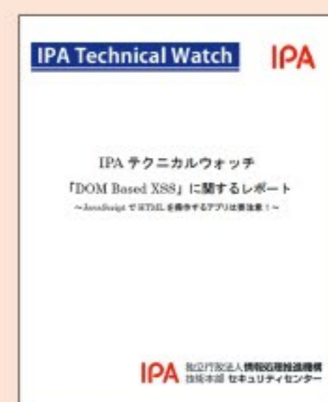
IPAテクニカルウォッチ