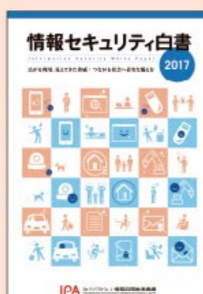
情報セキュリティ白書