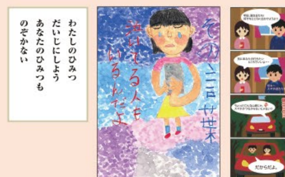
ひろげよう情報モラル・セキュリティコンクール