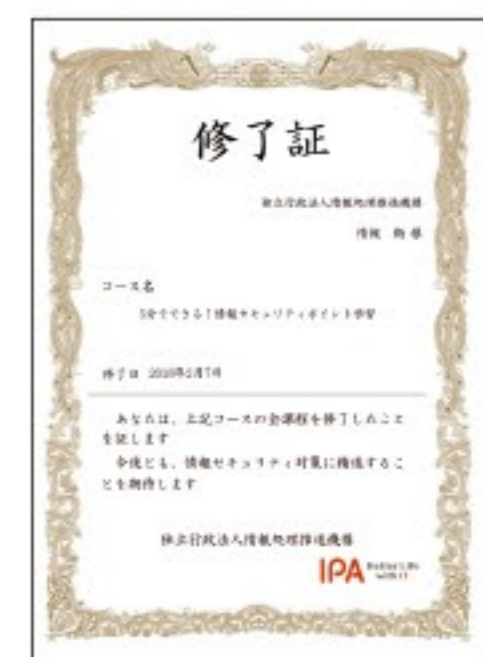
確認テストに正解したら修了証を発行