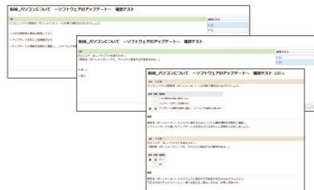
学習後は確認テストで理解度チェック