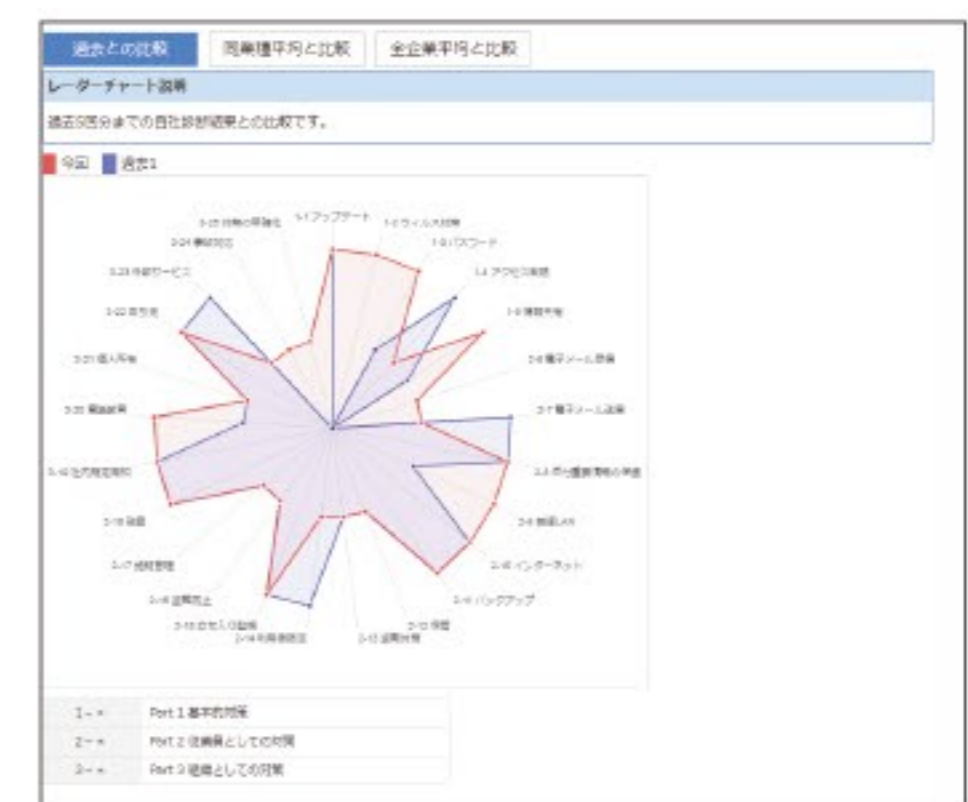
診断結果は、自社の過去結果や全体平均、同業平均との比較が可能