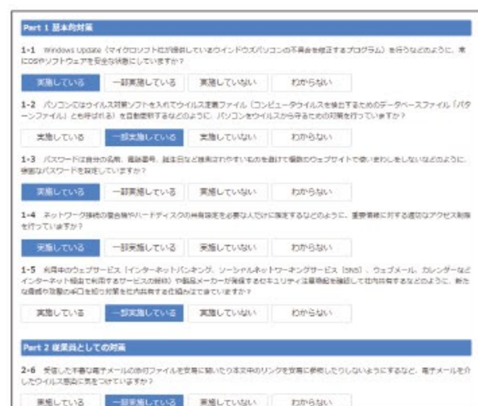
自社の状況を回答

<新しい診断項目にオンライン版でも対応> 2016年11月に改訂された「5分でできる!情報セキュリティ自社診断」の25の診断項目にオンライン版に対応しました。