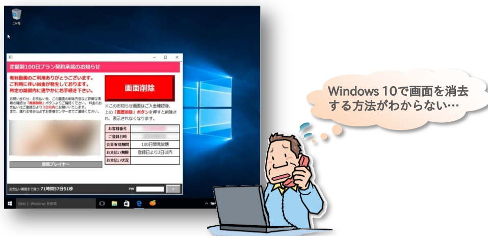
図 1 : Windows 10 のパソコンでアダルトサイトの不正画面が表示されるイメージ

2015 年 7 月 29 日より、特定の条件を満たすパソコンに対して Windows 10 への無償アップグレードの提供 ※1 が始まりました。そのため、8 月以降は Windows 10 の利用者からの相談も寄せられるようになりましたが、その中には「パソコンにアダルトサイトへの登録完了や費用請求の画面（以下、不正画面）が表示されるようになってしまった。どのようにすれば良いか。」という相談も複数含まれています ※2 。