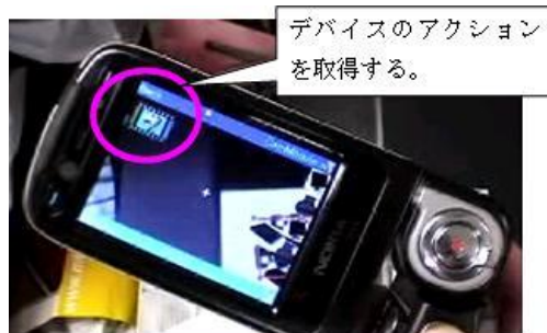
図3 ドラッグ時の画面

利用するサービスを選択し、連携を行いたいデバイス同士をドラッグアンドドロップで連携させる(図3)。本システムでは、ホームビデオサーバーとディスプレイ、ディスプレイ同士、ディスプレイとプリンタの連携をサポートしている(図4)。