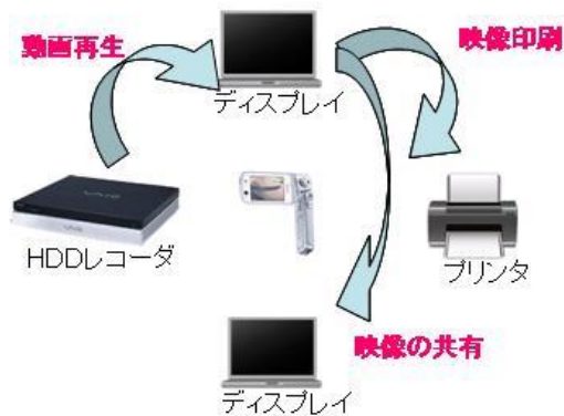
図 4 連携可能なデバイス一覧