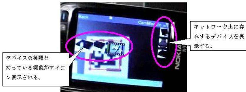
図2 サービス発見時の画面

デバイスに付与されたサービスタグを携帯電話で読み取ることで、デバイスに存在するサービスを発見する(図2)。