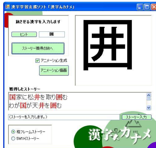
図3:システム起動画面