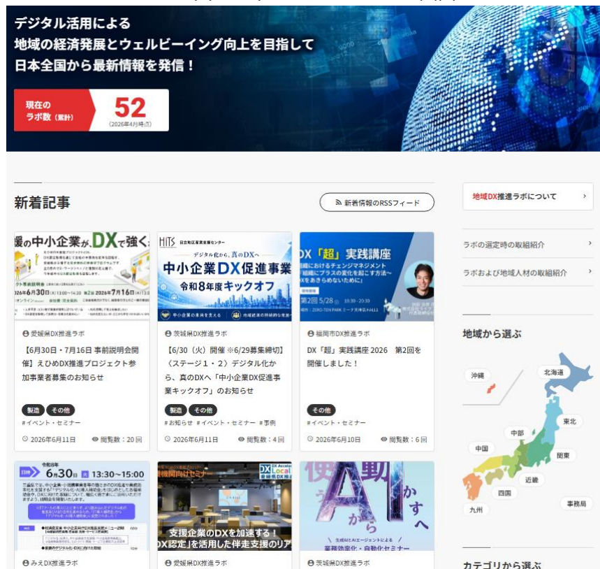
図 1：本システムのトップ画面

その一環として、関係する自治体・事業者等の本取組に対する関心を喚起するとともに、地域ラボ間の相互の交流等を促進させることを目的として、2024 年 8 月に、ポータルサイト第三期システム（以下「本システム」という。）を構築し、各地域ラボの取組状況及び関連イベントの紹介等の情報を発信している。