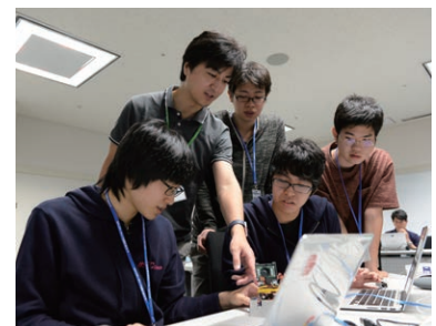
専門講義 演習を交えた実践的な講義を実施しました。 全体講義 技術面と倫理面からの講演を実施しました。