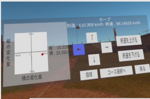
投球軌道を自由に作成