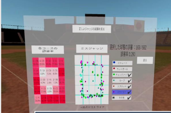
過去のジャッジ結果の表示分析