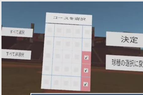
好きな球種やコースを選択