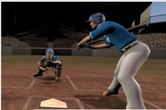
捕手や打者のリアルな動作