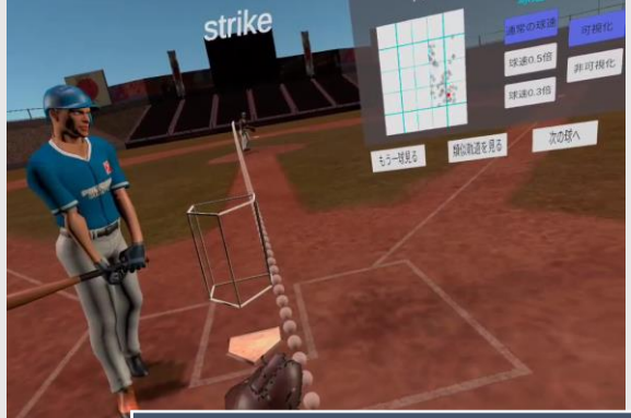
軌道・ゾーンを可視化