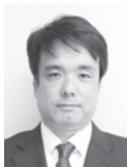
松本 健一 +3

fault-prone モジュールのランク付け精度を向上させる手法を提案する。ランク付けには fault-prone 判別得点として、判別モデルにより得られる判別得点とコードレビューの評価得点を組合せた値を用いる。まず、判別性能が高いモデルを用いてコードレビューによる精度の向上を評価する。次に精度をできるだけ維持したまま工数を削減する3つの方法を提案する。削減方法は、1：構築コストの小さい判別モデルの利用、2：レビュー対象のモジュール数の削減、3：一部のレビュー観点の省略、である。これらの結果、従来の判別モデルにコードレビューによる評価得点を組合せることで fault-prone モジュールのランク付け精度が向上することが判った。また、レビュー工数の削減については、ランク付け精度を維持したまま 46% の工数を削減できることが判った。