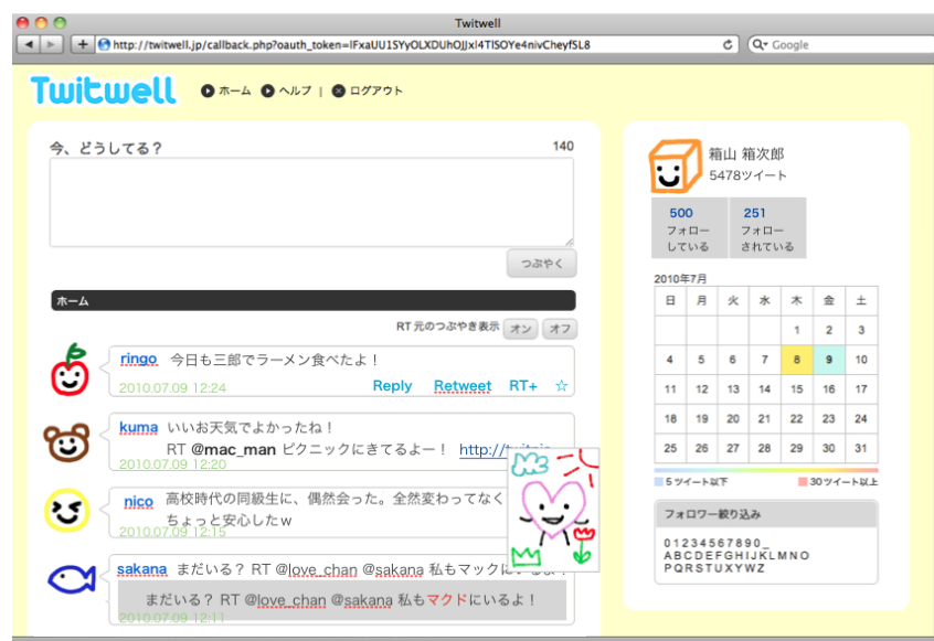
図 1. 画面全体のイメージ