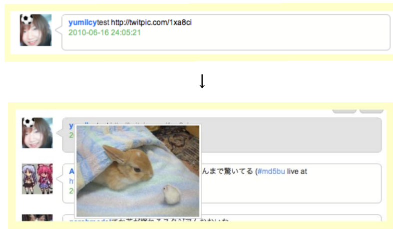
図 9. twitpic のサムネイル表示