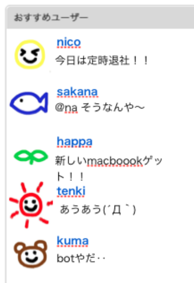
図 7. おすすめユーザの表示

自分のフォローしているユーザがフォローしていて、自分がフォローしていないユーザを5人表示。フォローしていない、共通の友人を見つけることができる。