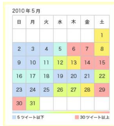
図 6. つぶやき数に応じてカレンダーの色を変化