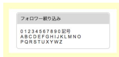
図 5. フォロー、被フォローユーザの整理