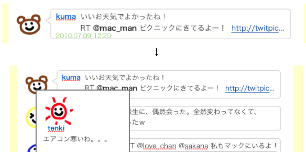
図 2. メッセージ中にユーザ画像の表示