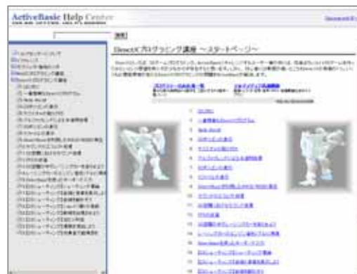
図 4「ヘルプセンター」