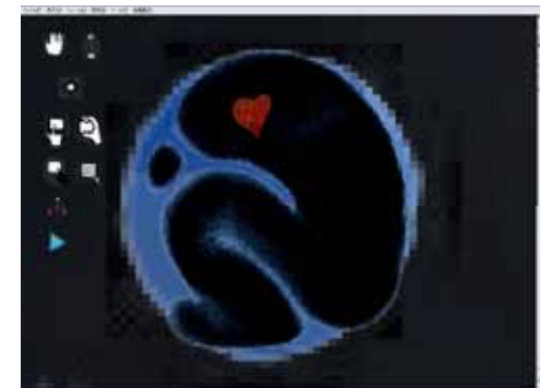
絵の中に絵を埋め込んでいく