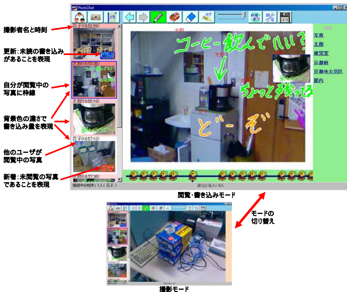
図 2 PhotoChat のユーザインタフェース

している。目的の写真を探したいときには、いつ、どこで、誰と、何のイベントを体験していたときかといった情報があれば多くの場合十分であると考え。そこで、端末の時計から時刻、GPS（別途レシーバーが必要）情報から地名、マイク入力音声の類似度から誰が近くにいたかの情報を自動的に写真に付加する。イベント名も最初にユーザグループを設定するときに入力するため、それが利用できる。