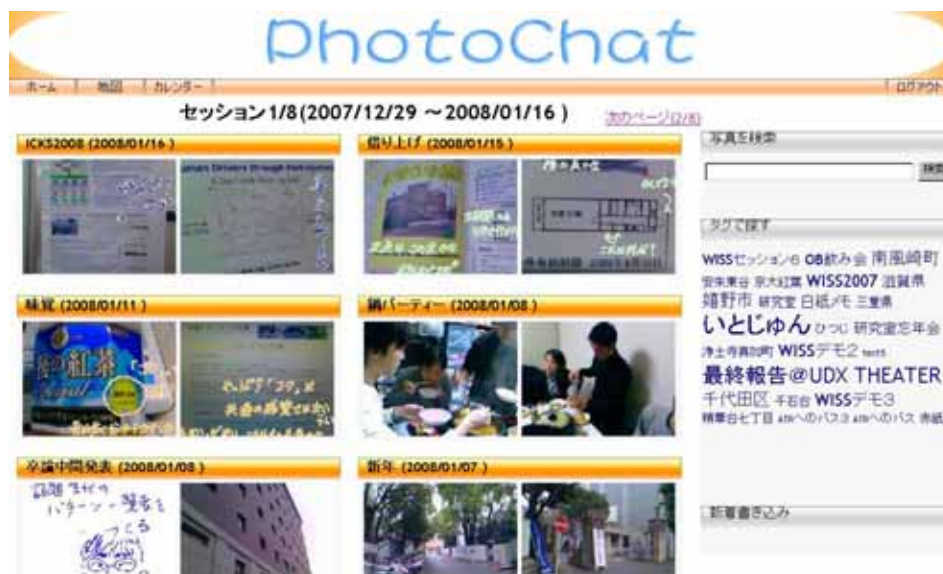
図 3 実世界ブログ

ば写真と手書きメモにより自由にコンテンツを作成できるので、体験の現場でブログを書くといったことも可能となる。