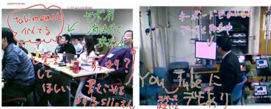
図 4 PhotoChat 上での写真

ような場では有益である。右の写真は複雑な機器についてのデモが行われているときに撮影されたものである。こうした記録にはマニュアルにはないノウハウが記録されることもあり、実用的なコンテンツを得ることができる。また、PhotoChat を使って専門家が初心者を使い方を教えることで、最終的に他の初心者にとっても分かりやすい簡易マニュアルが作成できる。