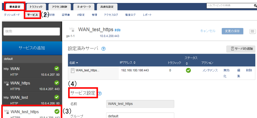
図 1.1.2-1 プロパティ一覧画面