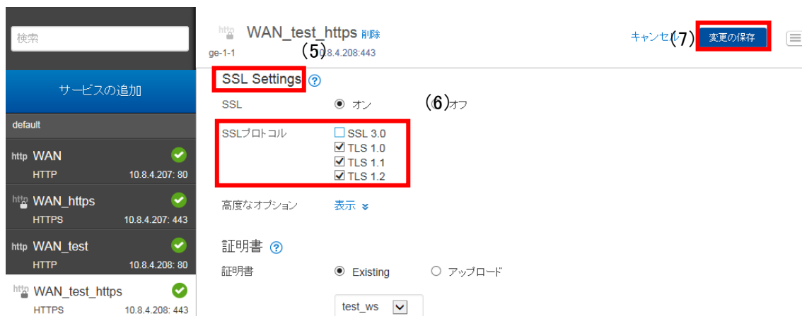
図 1.1.2-2 プロパティ編集画面 (プロトコルバージョン)