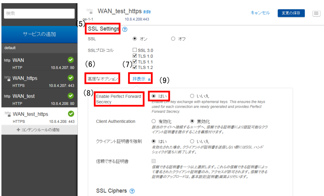
図 1.1.2-4 プロパティ編集画面（暗号スイート） -2

B) (5) SSL Settings の (6) 高度なオプションを (7) 「表示」し、(8) Enable Perfect Forward Secrecy の (9) 「はい」を選択する。