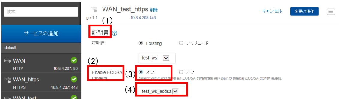
図 1.1.2-3 プロパティ編集画面（暗号スイート） -1

B) (5) SSL Settings の (6) 高度なオプションを (7) 「表示」し、(8) Enable Perfect Forward Secrecy の (9) 「はい」を選択する。