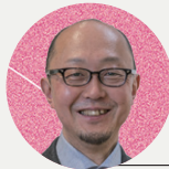
うるしばらしげる 漆原 茂

大阪大学大学院 基礎工学研究科 システム創成専攻 教授 (特別教授) ATR石黒浩特別研究室室長 (ATRフェロー)