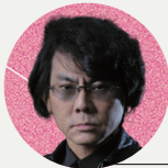
いしくろ ひろし 石黒 浩

大阪大学大学院 基礎工学研究科 システム創成専攻 教授 (特別教授) ATR石黒浩特別研究室室長 (ATRフェロー)