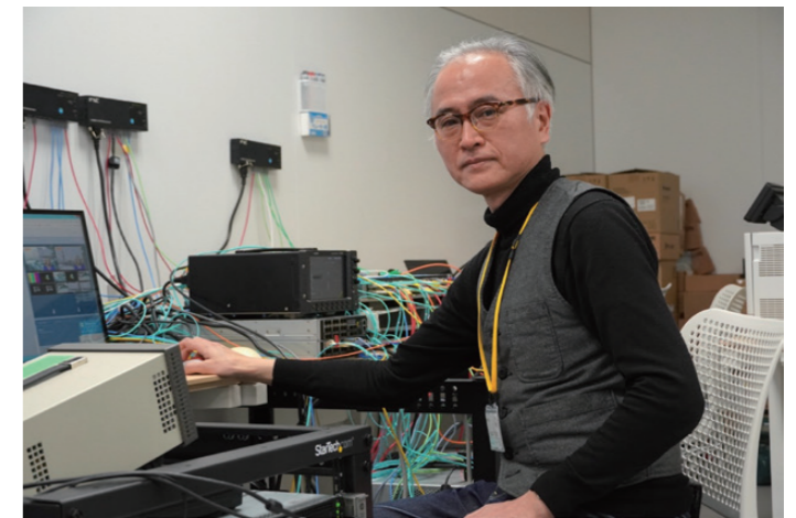
実験用機器をICSCoEの拠点に持ち寄って実験を行いました

池上通信機として4年目の今回の実証実験で得られたサイバーセキュリティや IP リモートプロダクションの技術的成果