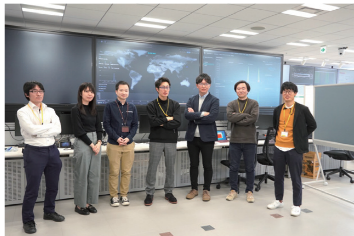
ペネトレーションテストメンバー

去にも参加している者が大半です。モチベーションとしては、この取り組みで得た技術や知見を自社に持ち帰ることができることがあります。マルチキャスト方式を用いた先進的な環境による本番と同等の実証できる機会というのは、民間ではなかなかありません。この取り組みなら、個別企業の予算を超えた規模の環境で、他業界の方と連携し、情報交換をしながら知見を高めることができます。