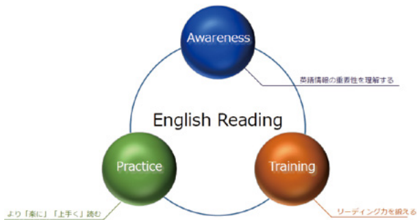
英語学習を3つの柱でモデル化

「Awareness」「Practice」「Training」の3つの柱で英語の学習をモデル化して、能力向上への道筋を解説しています。