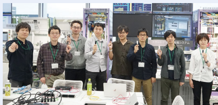
プロジェクトメンバーの皆さん

一年学んだことで、サイバーセキュリティのエキスパートになったという手ごたえが得られ、自身のキャリアで大きな分岐点となったと感じています。セキュリティに携わる者として新しいスタートを切ったと思い、帰任後の業務に挑んでいます。