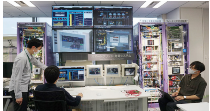
テストに使用した模擬プラント

テスト計画書および報告書作成のための基礎知識を学びました。その際に、テストの難しさを認識するとともに実践的な気付きを得るために、ICSCoE秋葉原拠点にある模擬プラント(電力システム)を活用しました。