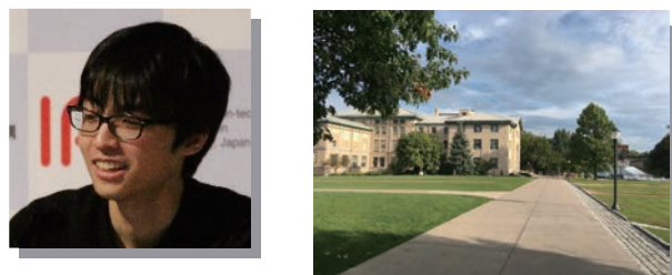
客員研究員として滞在した カーネギーメロン大学のキャンパス