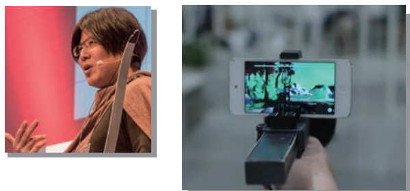
「VAIR Field」で使用する、 スマートフォンを利用した銃型デバイス「VAIR Gun」

神奈川工科大学 情報学部情報メディア学科 准教授／ 株式会社 CENOTE 代表取締役