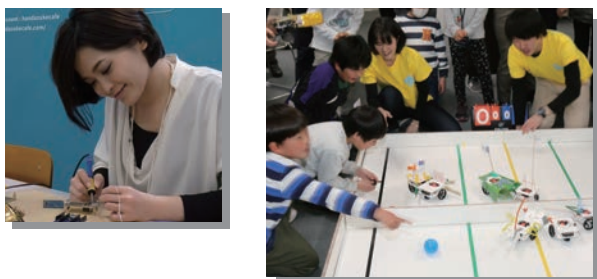
マイコンボード「micro:bit」を使用したサッカーロボット制作ワークショップ