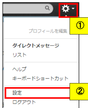
図 5 : Twitter の設定画面 1