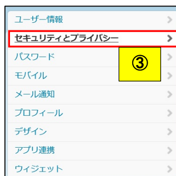
図 6 : Twitter の設定画面 2