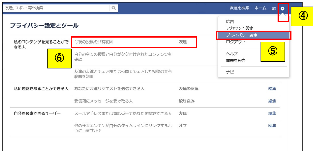
図 4 : Facebook の設定画面 3