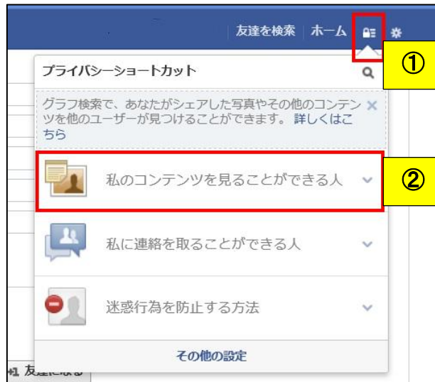
図 2 : Facebook の設定画面 1

以下の設定から、全ての利用者、友達、自分のみ、などの選択肢から公開範囲を指定できます。