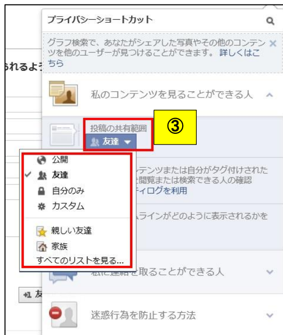
図 3 : Facebook の設定画面 2