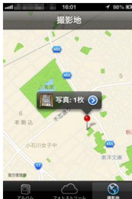
図 9 : 写真から撮影場所が特定された表示画面

トラブルを未然に防ぐためには、スマートフォンの設定が、適切になっているか、 写真データをインターネット上に公開する前には、ジオタグの有無を再度確認することが大切 です。