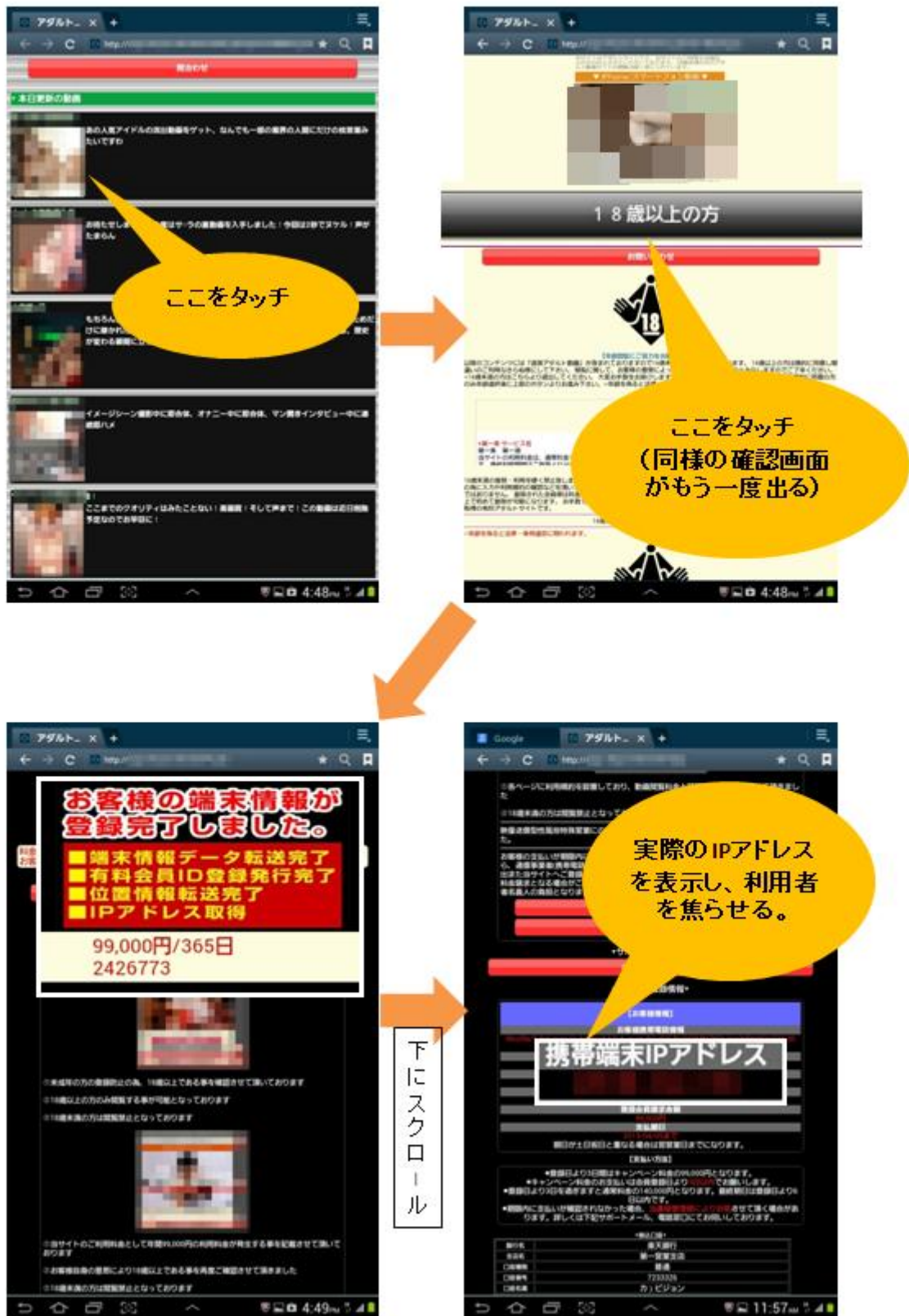
図4：アプリ実行後に表示されるアダルトサイト