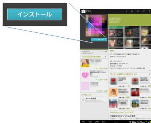
図2：Google Play でのアプリ紹介画面