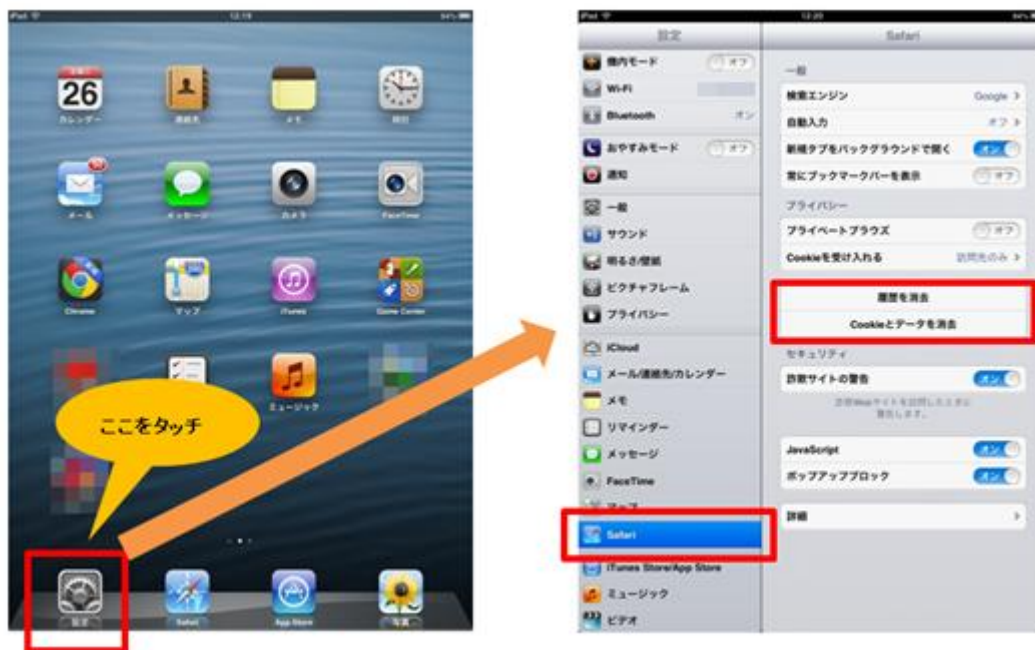
図8：Safariで履歴、Cookieなどを消去する方法（iPad）

ホーム画面の「設定」、設定画面の「Safari」を順にタッチし、そこで「履歴を消去」と「Cookieとデータを消去」をタッチします（図8）。