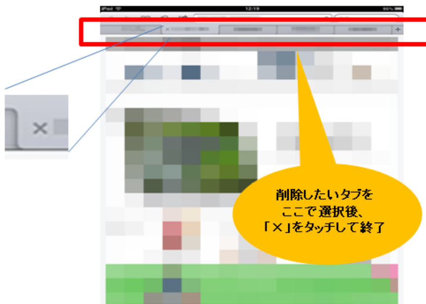
図6：Safariのタブ一覧からタブを終了させる方法（iPad）

ブラウザ（Safari）を開くと、直接タブを選択できるようになっていますので、終了したいタブを選択した状態で×ボタンをタッチします（図6）。