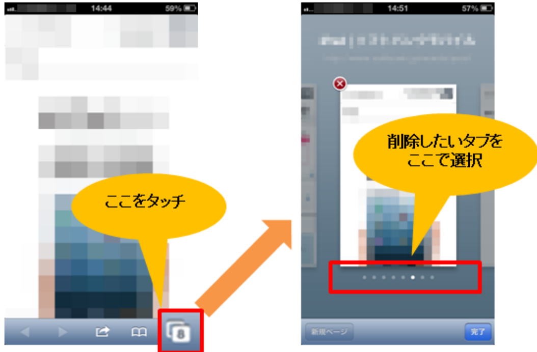
図5：Safariのタブ一覧からタブを終了させる方法（iPhone）

ブラウザ（Safari）を開き、画面右下のマークをタッチします（図5の左図）。すると現在 Safari で開いているタブが横並びで表示されます（図5の右図）。この例では現在8つのタブが開かれていて、そのうち左から6番目のタブの内容が表示されている状態です。囲みで示した小さい点をタッチすると、対応したタブの内容が表示されるので、終了したいタブの場合は赤×ボタンをタッチして終了させます。