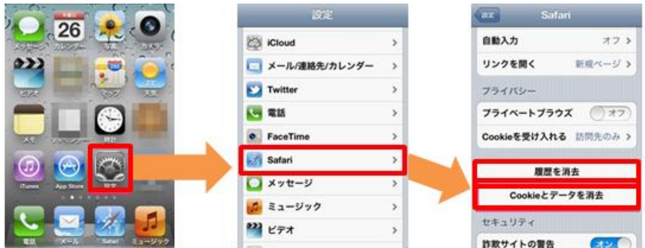
図7：Safariで履歴、Cookieなどを消去する方法（iPhone）

ホーム画面の「設定」、設定画面の「Safari」を順にタッチし、そこで「履歴を消去」と「Cookieとデータを消去」をタッチします（図7）。