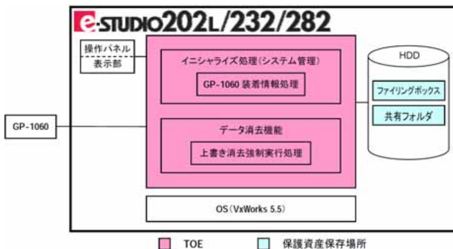
図1-3 自己診断モード時の構成