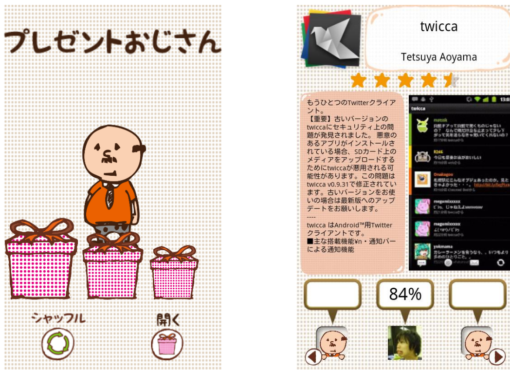
図 1 クライアントアプリ(左:トップ画面、右:アプリ紹介画面)

本プロジェクトでは、Android を対象としたアプリ紹介システムを開発した。本システムでは、ユーザのアプリ利用状況をサーバに蓄積し、その情報と Facebook のソーシャルグラフを利用して、ユーザに対するアプリのおすすめ度を算出し、アプリの紹介を行う。紹介するアプリの数は、一度につき3つとした。アプリの紹介は、プレゼントとして表現する。