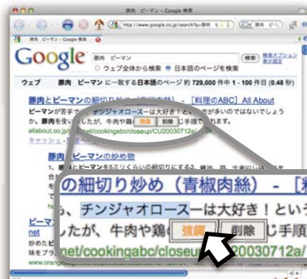
興味のある単語を「強調」すると...