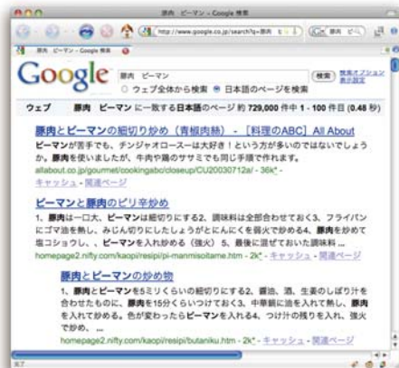
検索結果を閲覧しているときに...