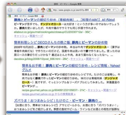
選択した単語を含んだ検索結果が上位に表示されます